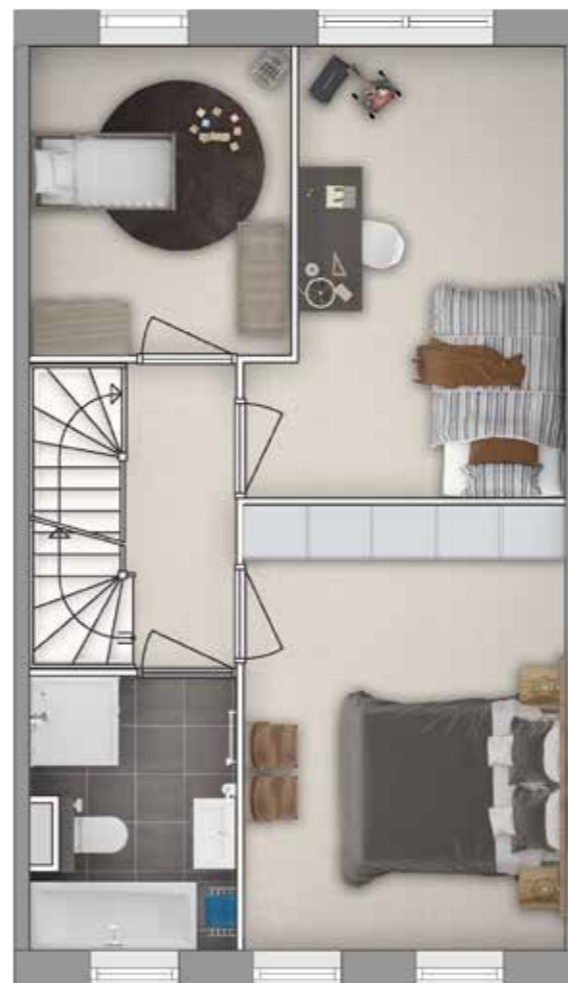
Plattegrond A Stijl stedelijk Geveltype 2 Eerste verdieping