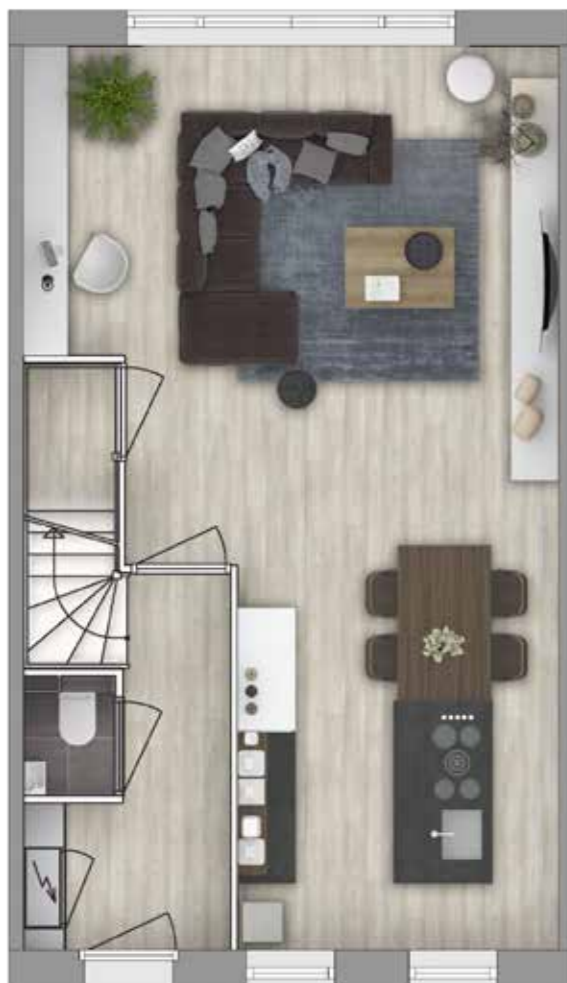
Plattegrond A Stijl stedelijk Geveltype 2 Begane grond

Liever een andere indeling? Check de woonconfigurator op www.carteblanchepionierkwartier.nl en ontdek alle mogelijkheden.