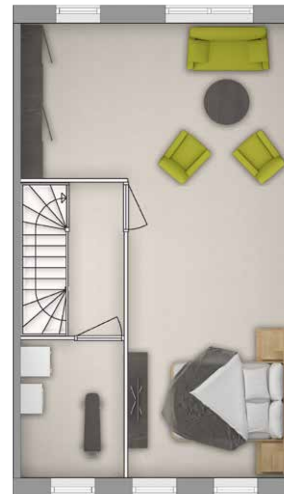
Plattegrond A Stijl stedelijk Geveltype 2 Tweede verdieping